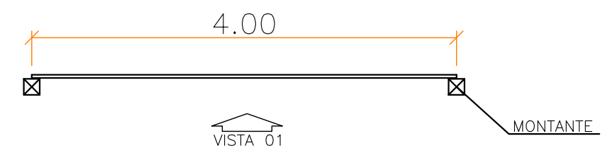
PLANTA BAIXA - PORTÃO esc 1:50