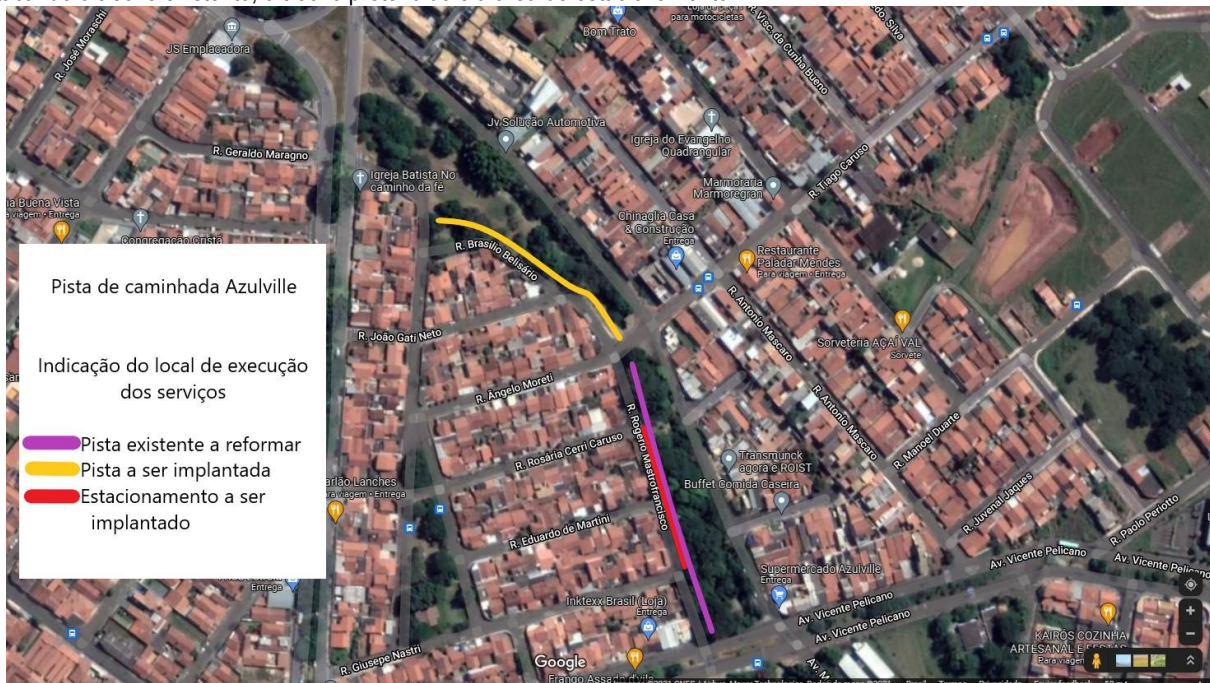
Figura 1: Indicação do local de execução dos serviços

2.1. Há alguns anos foi implantada uma pista de caminhada ao longo da rua Rogério Mastrofrancisco, contando com iluminação, bancos e academia ao ar livre. Os moradores da região demandam a manutenção e revitalização desta área, com a implantação de estacionamento de veículos, recuperação da iluminação e do calçamento danificado. Também pedem a ampliação da pista, que se estenderia longo da rua Brasília Belisário, equipada também com iluminação e bancos. A figura 1 indica o local, destacando o trecho existente, o trecho pretendido e a área de estacionamento.