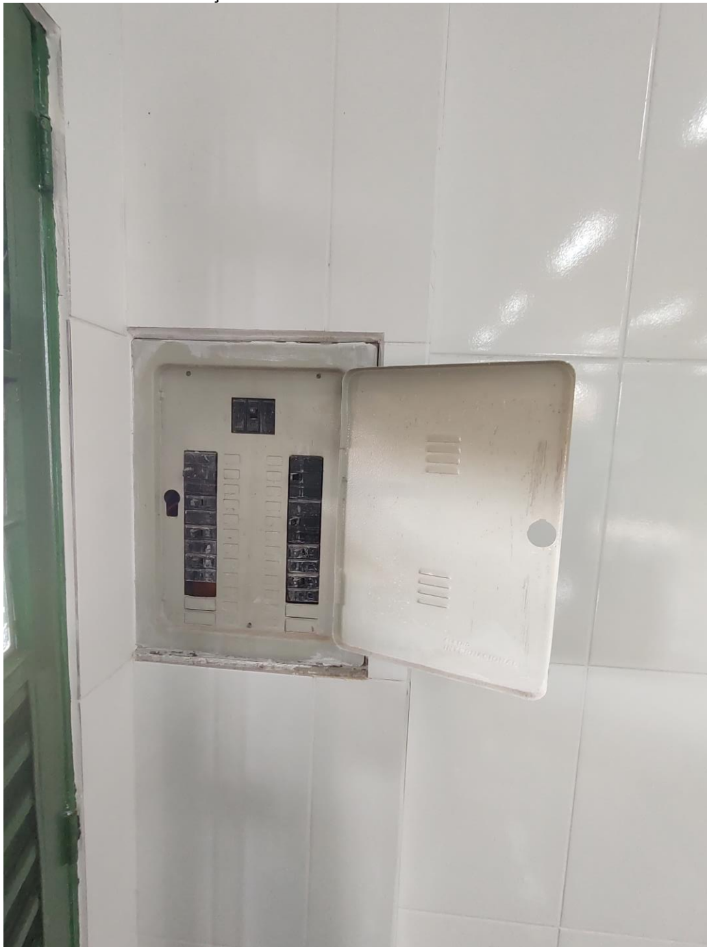
IMAGEM 3: QUADRO DE FORÇA DO BANCO DE ALIMENTOS