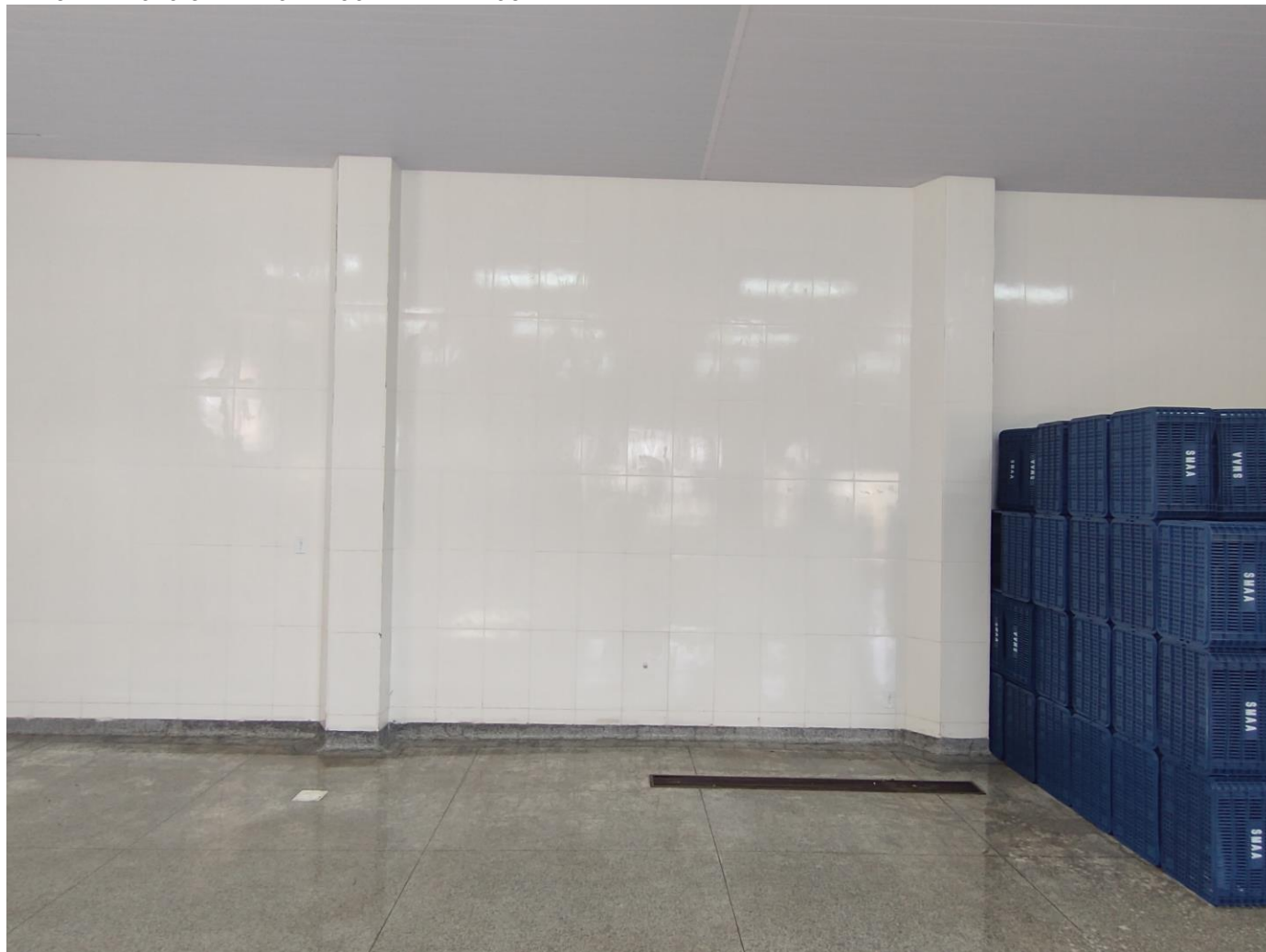
IMAGEM 1: FOTO GERAL DO BANCO DE ALIMENTOS.