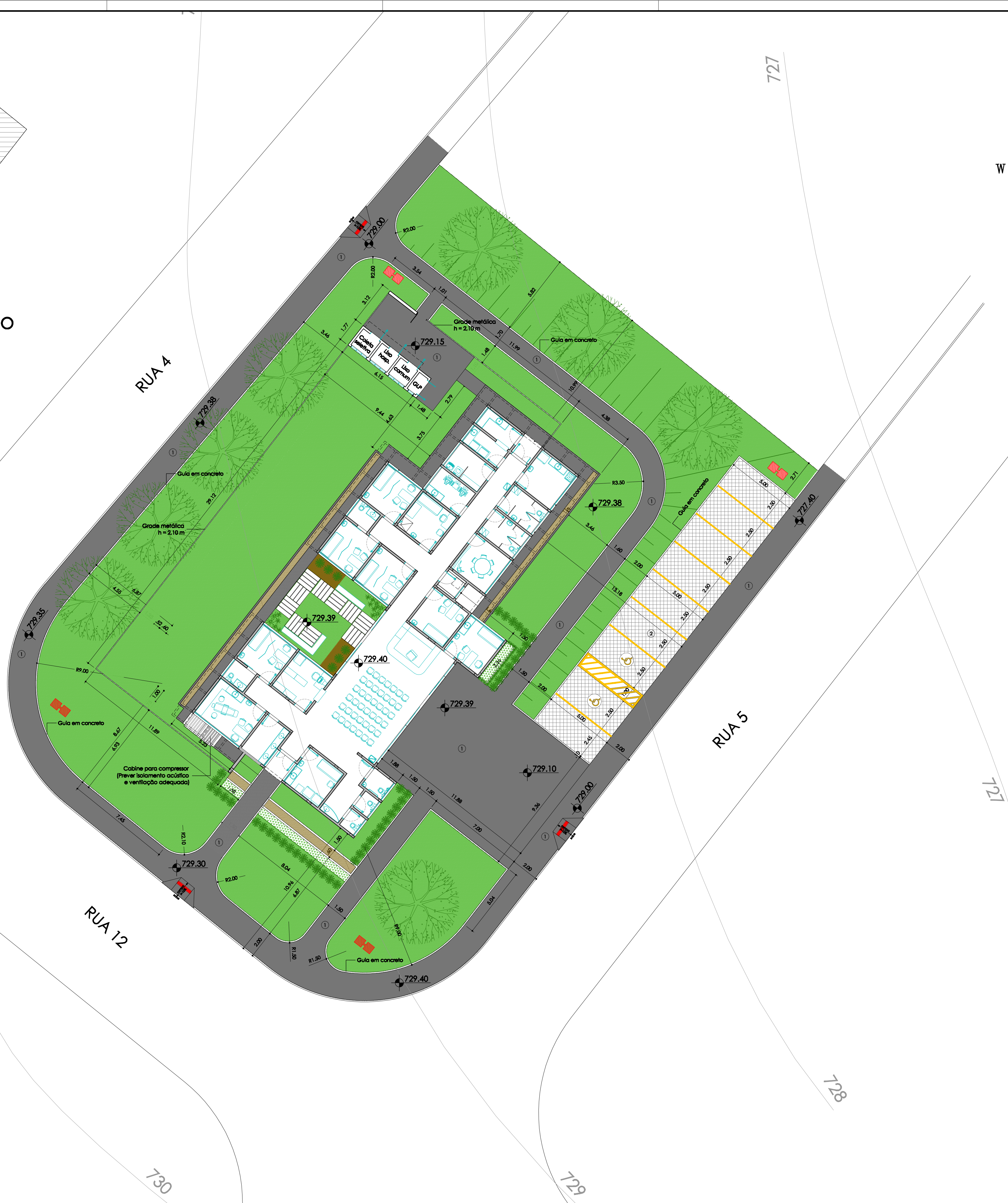
Implantação Escala 1:150